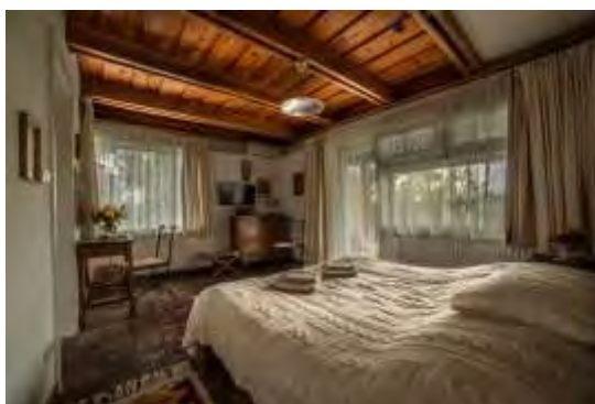
Káli Art Inn

A Káli-medencét sokan hívják Mini-Provence-nak, és ez a szálláshely pont erre játszik rá. És nagyon jól. Rusztikus mediterrán elemek keverednek a modern trendekkel, közben ügyesen becsempészi a magyar falusi hangulatot is. Mindezt varázslatos természeti környezetben.