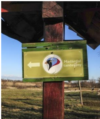
A Madárdal tanösvény jelképe a bájos barkóscinege

A Madárdal tanösvény Müller Istvánról elnevezett szakasza egy körút, amelynek nagyjából a közepén madárgyűrűző állomást és magaslest találunk. Az utóbbiból rálátni a fertő kócsagtelepére, ahol a nagy kócsagok mellett az Afrikából visszaérkezett kanalasgémek is fel-feltűnnek már.