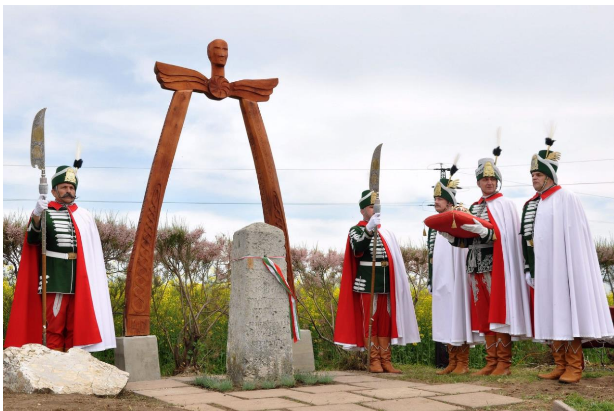
Pogánykő, honfoglaláskori sírhely, Vereb.